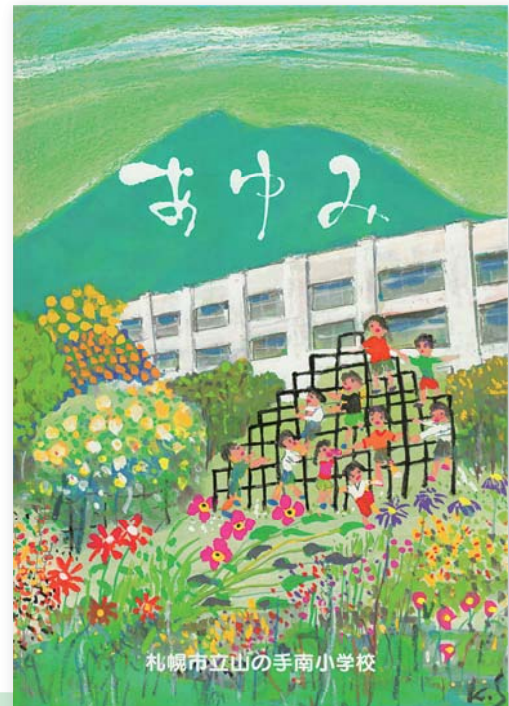
札幌市立山の手南小学校