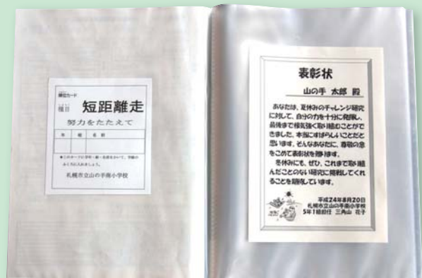
▲賞状なども一緒にファイルに入れる