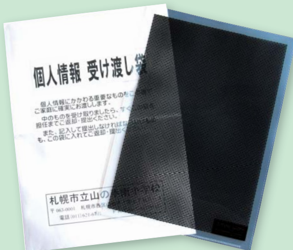
▲ファイルと封筒の二重の袋に入れて配布